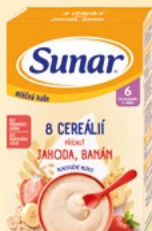
Sunar® mléčná kaše 210 g, různé druhy 100 g = 40,00 Kč