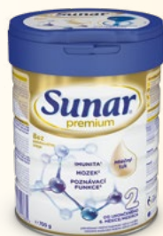
Sunar® Premium 2, 3 a 4, 700 g 100 g = 57,00 Kč