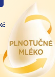
Sunar® Complex 2, 3, 4 a 5, 600 g 100 g = 41,50 Kč