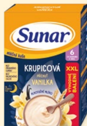
Sunar® mléčná kaše 340 g, různé druhy 100 g = 37,35 Kč